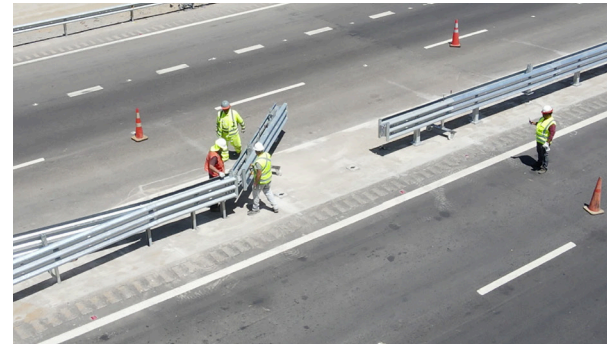
Apertura Rápida para Vehículos de Emergencia.