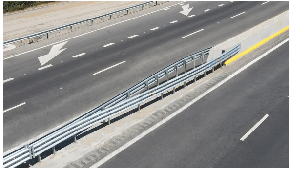
Transición Certificada a Barreas Metálicas y de Hormigón.