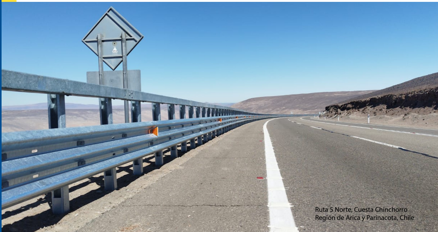
Ruta 5 Norte, Cuesta Chinchorro Región de Arica y Parinacota, Chile